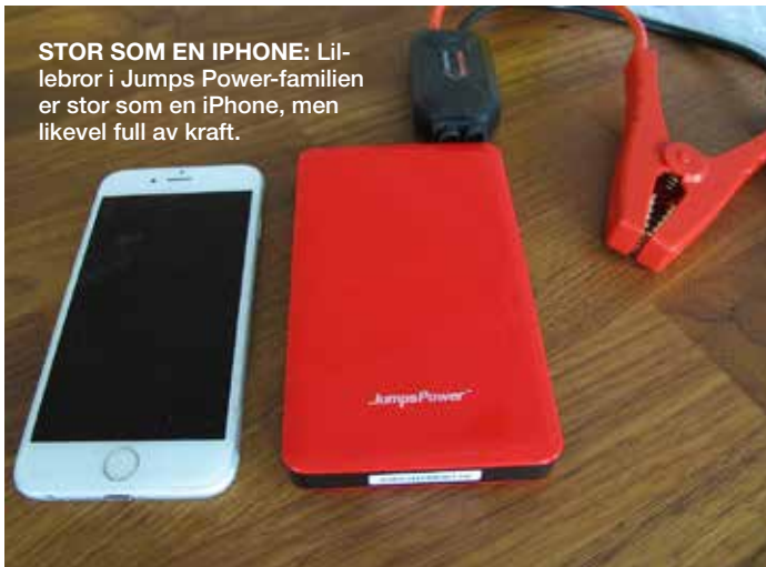
STOR SOM EN IPHONE: Lillebror i Jumps Power-familien er stor som en iPhone, men likevel full av kraft.