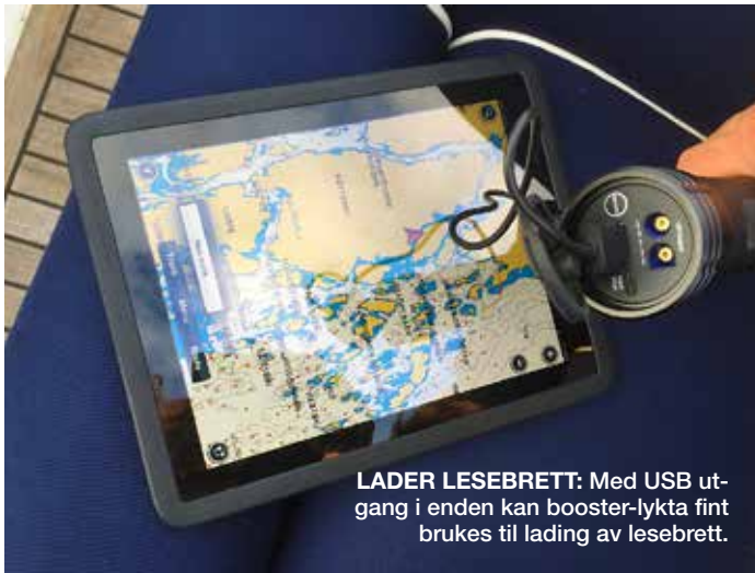
LADER LESEBRETT: Med USB utgang i enden kan booster-lykta fint brukes til lading av lese Brett.