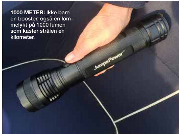
1000 METER: Ikke bare en booster, også en lommelykt på 1000 lumen som kaster strålen en kilometer.